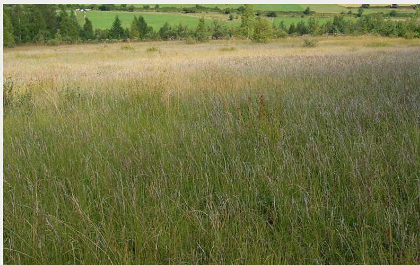
Tourbière du marais de Limagne (Ch. Bertholet)