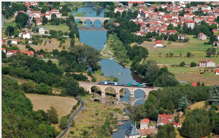
Lavoûte-sur-Loire (Christian Bertholet)