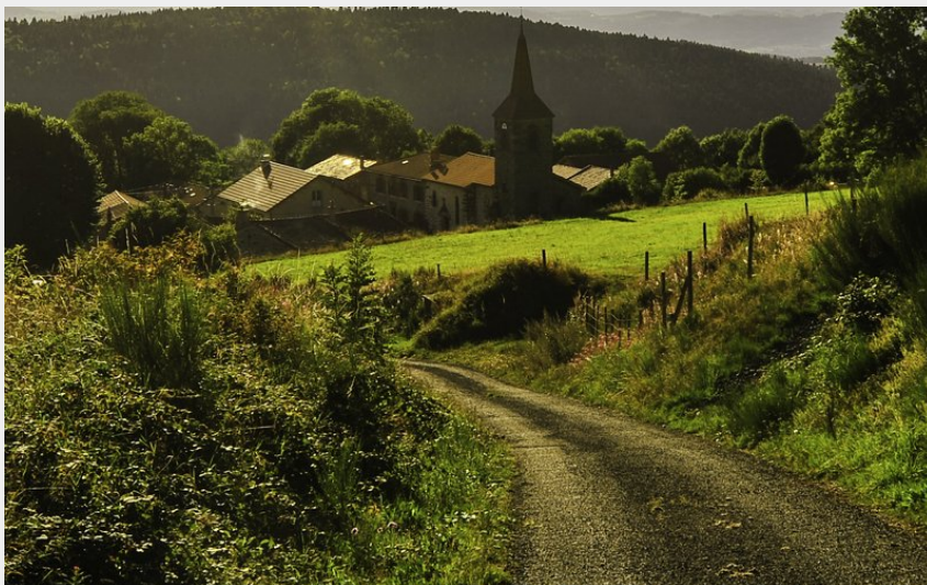
Varennes-Saint-Honorat (Norbert Dutranoy)