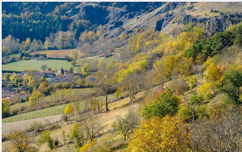
Vue sur la vallée de la Borne (Jérémy Mazet)