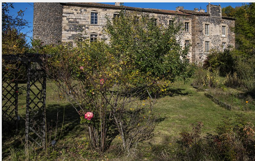
Abbaye de Pébrac