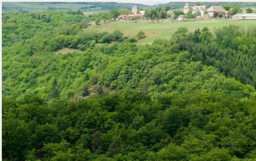
Ferme du Bos à Autrac (Jérémie Mazet)