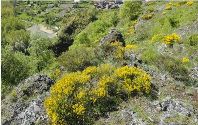
Rocher de Prades (Jérémy Mazet)