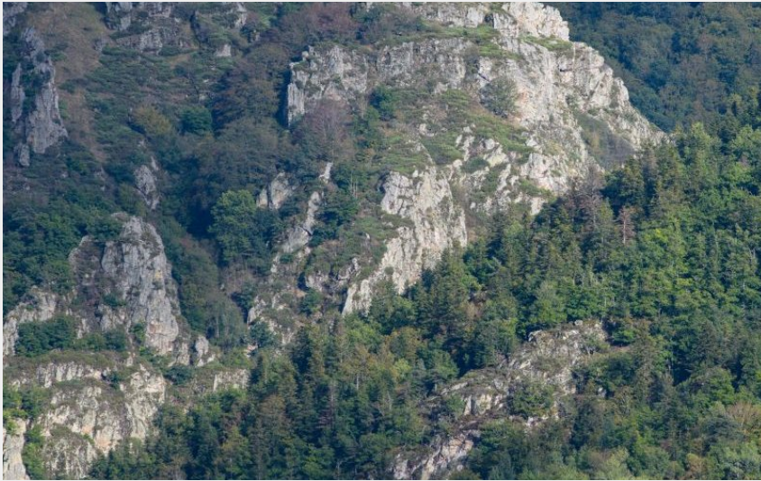
Les Gorges de l'Allier (Jérémy Mazet)