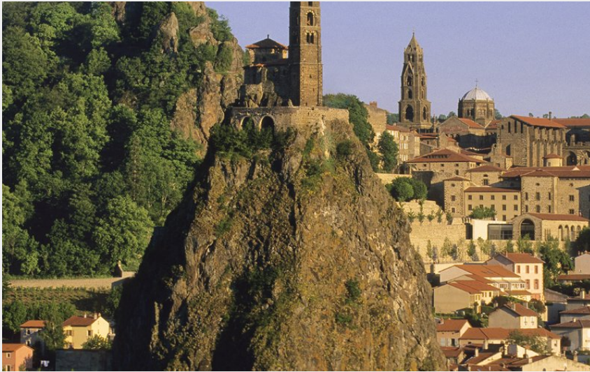
Le Puy-en-Velay