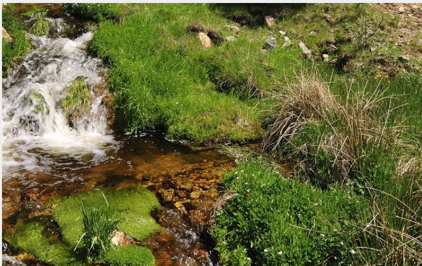
Ruisseau de la Margeride (Jérémié Mazet)