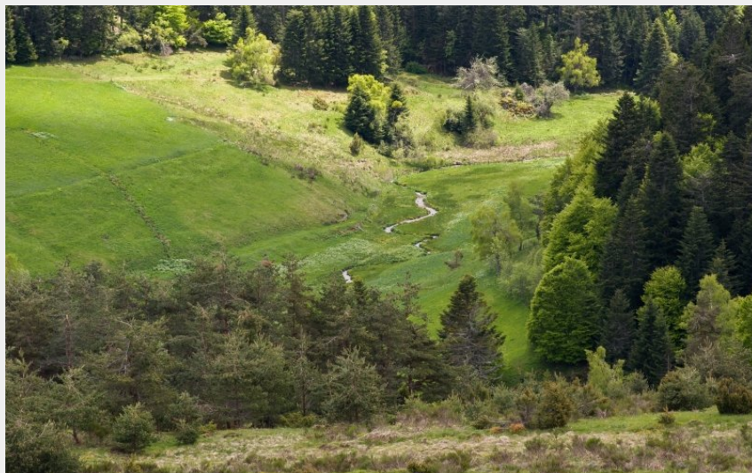
Le mont Mouchet (Jérémy Mazet)