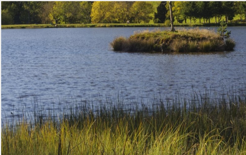
Plan d'eau de champagnac-le-Vieux (J. Mazet)