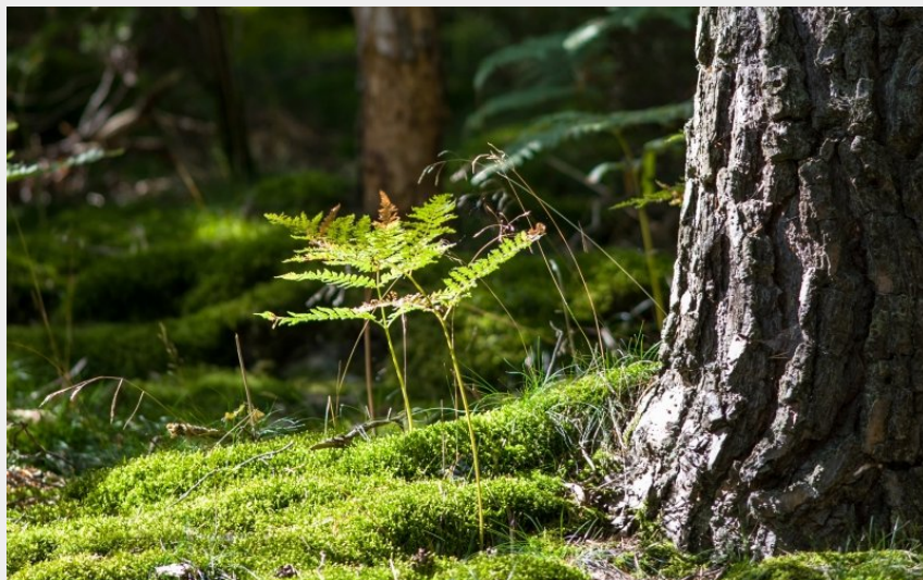
Forêt de conifères du Bois Noir (Jérémy Mazet)