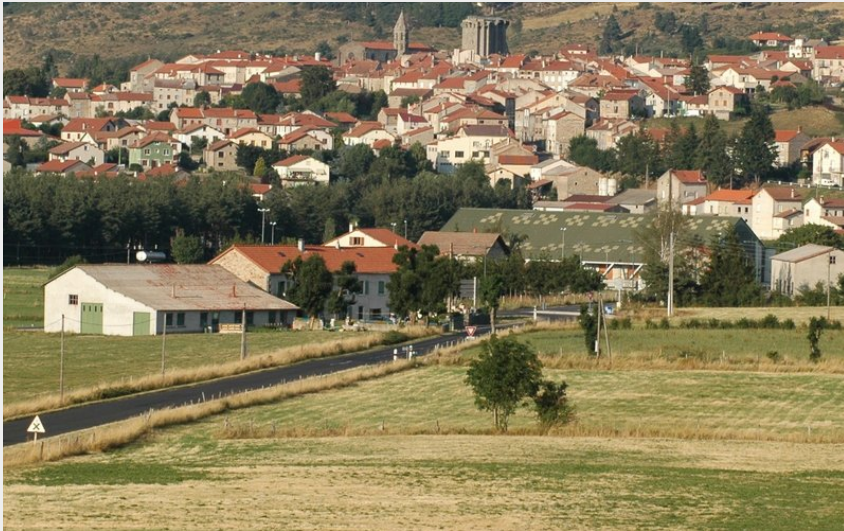
Vue sur Saugues (Christian Bertholet)