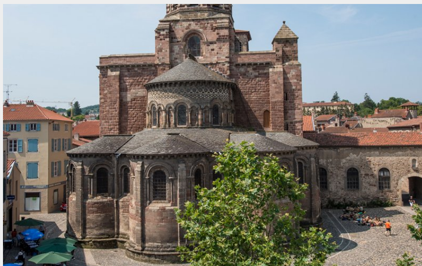
Basilique Saint-Julien-de-Brioude (Luc Olivier)