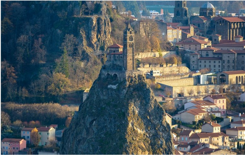
Vue sur le Puy-en-Velay (Jérémy Mazet)