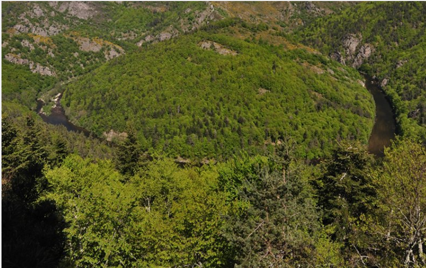
La boucle de la Taillide (Jérémie Mazet)