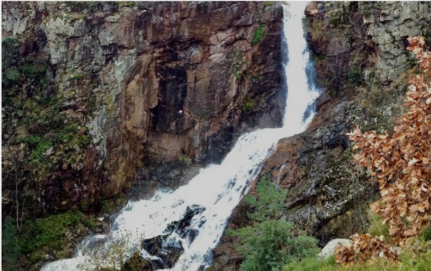
La cascade de Louade