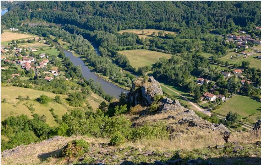
Vue depuis le Château d'Artias (Jérémy Mazet)