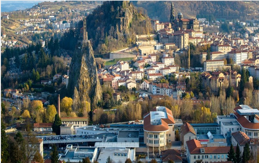
Vue sur Le Puy-en-Velay (Jérémy Mazet)