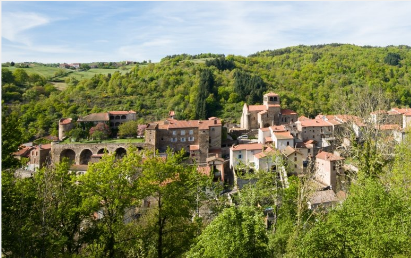
Vue sur Auzon et ses pigeonniers (Jérémy Mazet)