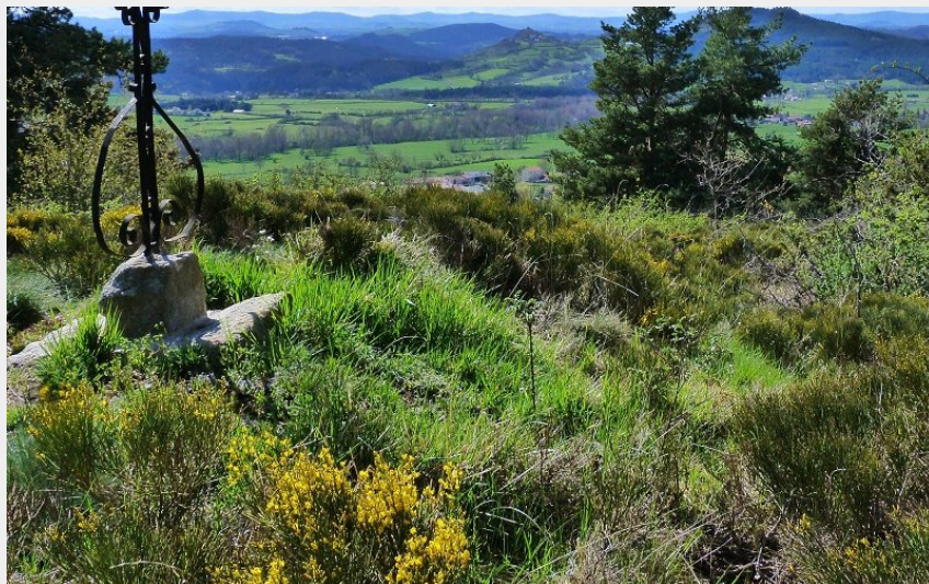
Vue depuis les Suchas (Claude Bruyère)