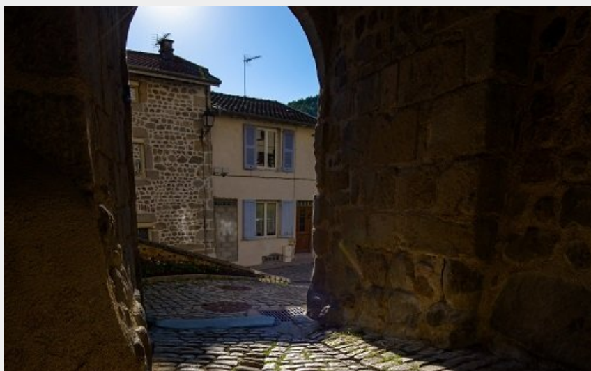
Vieux Aurec-sur-Loire (Jérémie Mazet)