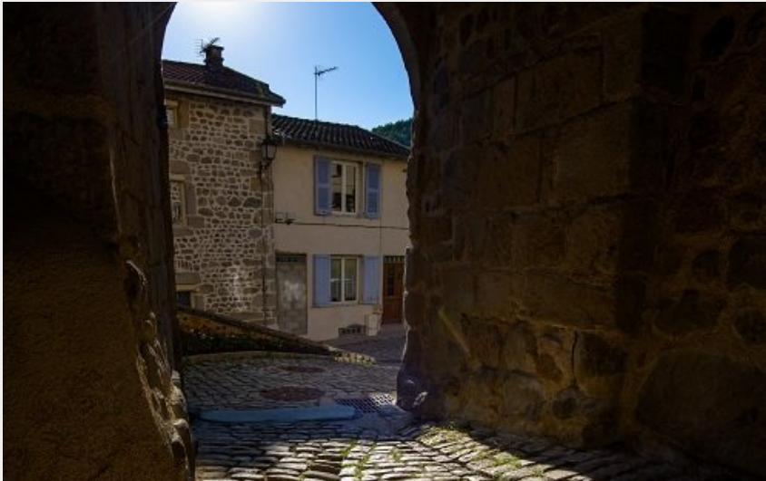
Vieux Aurec-sur-Loire (Jérémie Mazet)