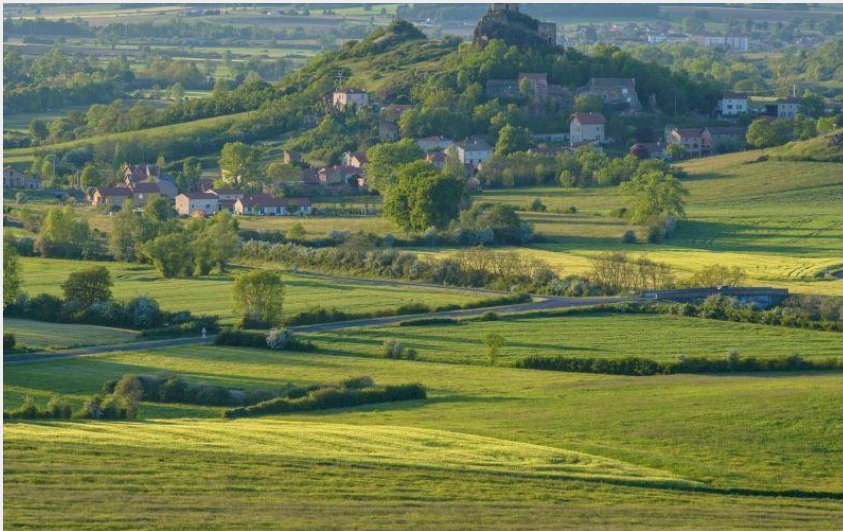
Village de Laroche avec ses ruines (Jérémié Mazet)