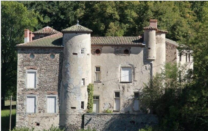
Le château du Mas (L. Barruel)