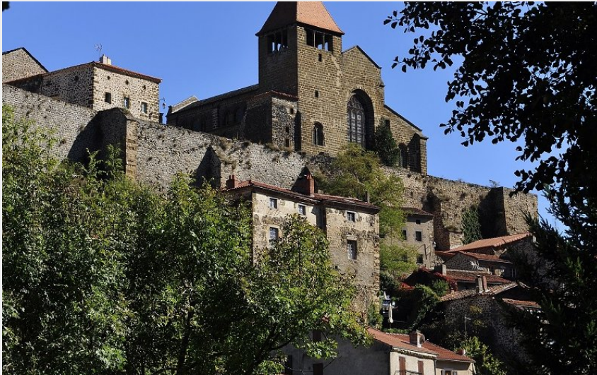
Village et église abbatiale de Chanteuges (C. Bertholet)