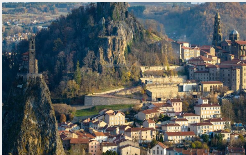
Le Puy-en-Velay (Jérémy Mazet)