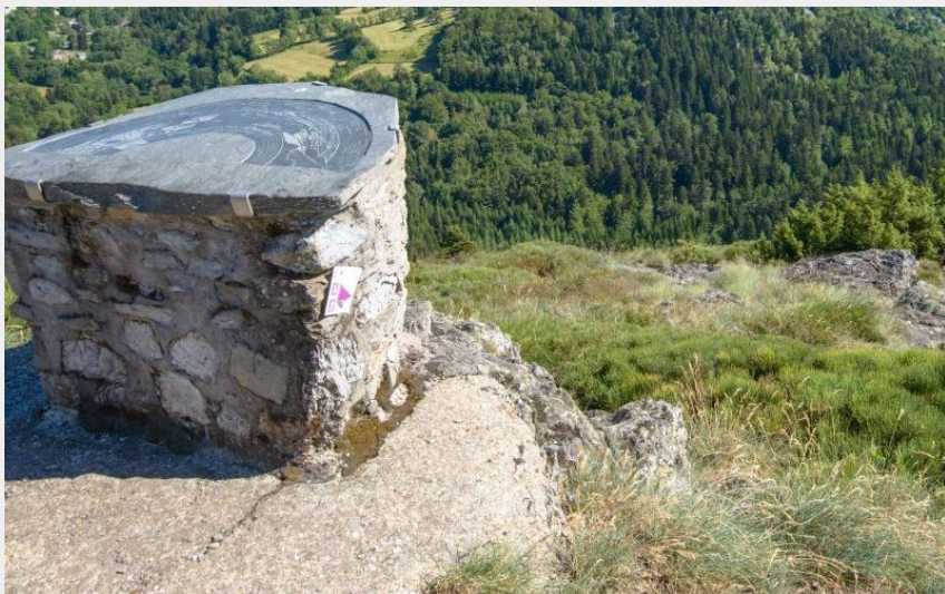
Saint-Julien-Chapteuil (Jérémie Mazet)