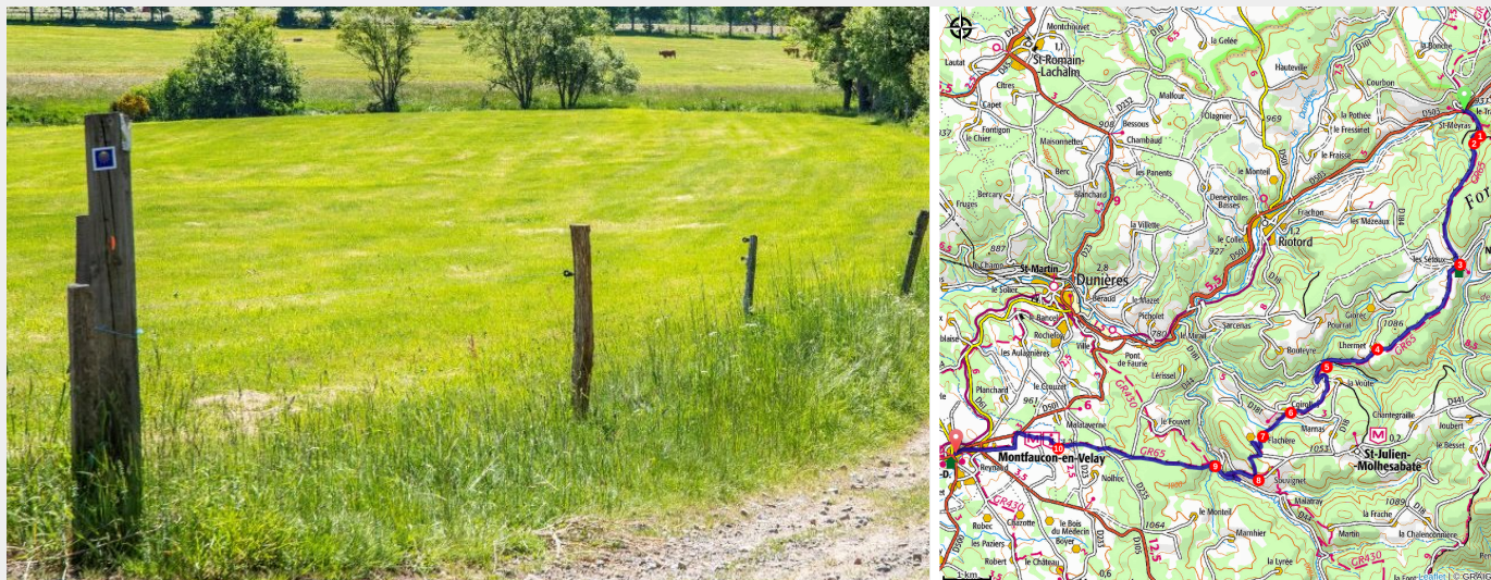
Près de Montfaucon-en-Velay (Luc Olivier)