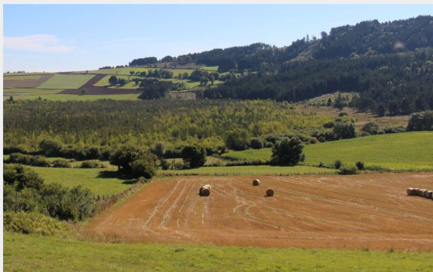
Marais de Limagne (CDRP 43)