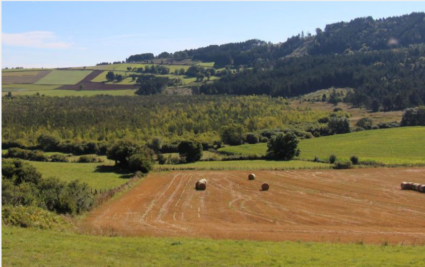
Marais de Limagne (CDRP 43)