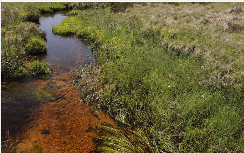
Tourbières de la Margeride (Jérémy Mazet)