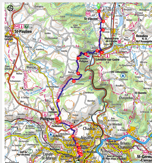
Micro aventure GR3 3 jours (CRRP Aura)