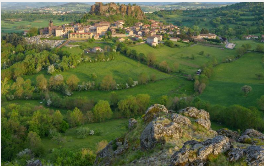
Vue sur Polignac (Jéréemie Mazet)