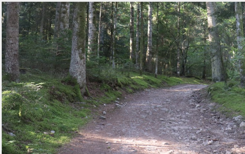
Forêt de sapins dans le Livradois