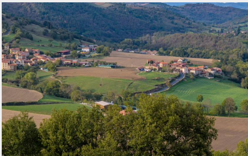
Vallée de l'Allier près de St-Ilpize (Jérémy Mazet)