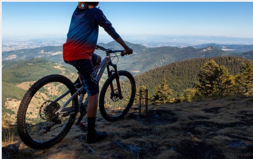
circuit VTT le Grand Felletin (Fabrice Beauvois)