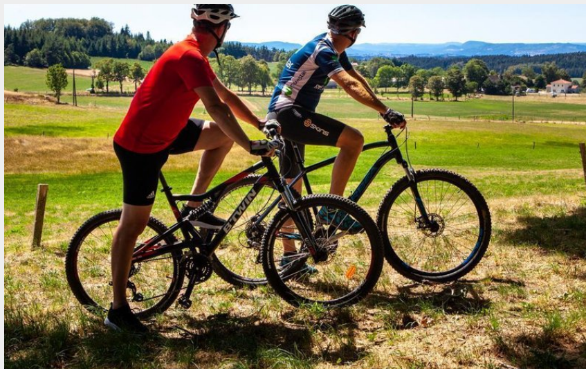
circuit VTT Le Gournier (Fabrice Beauvois)