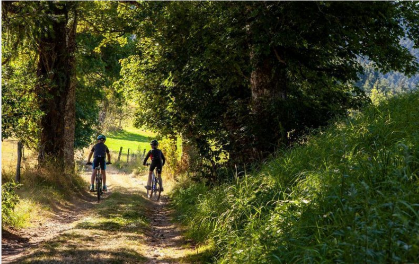
circuit VTT la Saint-Bonnette (Fabrice Beauvois)