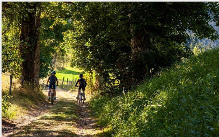
circuit VTT la Saint-Bonnette (Fabrice Beauvois)