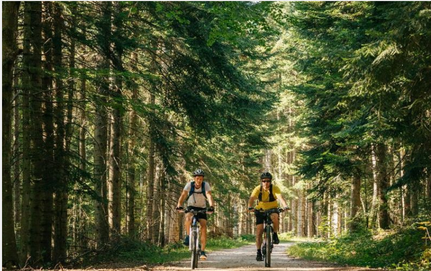
Au coeur de la forêt (Natuofilm)