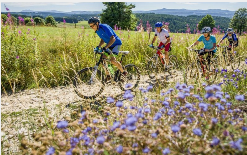
L'effort au milieu des fleurs (Luc Olivier)