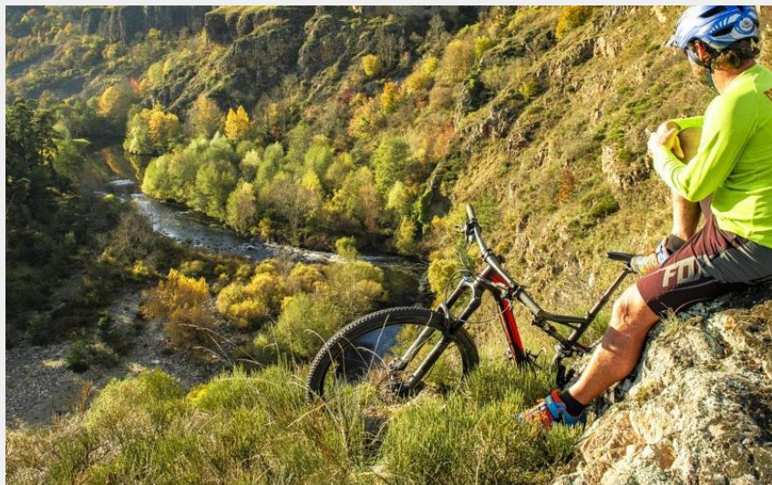
Pause nature (Luc Olivier)