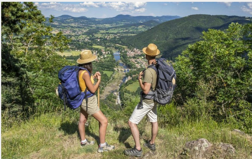
Le chemin de Compostelle de Cluny (Luc Olivier)