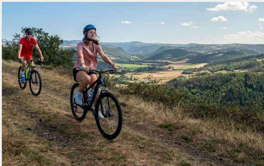
Évasion en VTT (MAZET_OT)