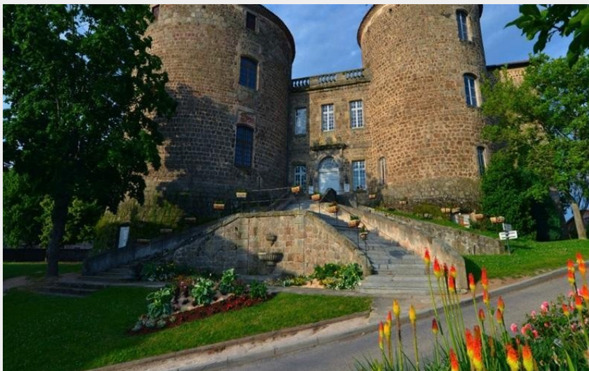
Le Château des Evêques à Monistrol-sur-Loire (Jean-Claude PARAYRE)