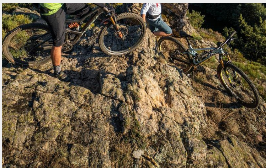
(Agence d'attractivité 43)