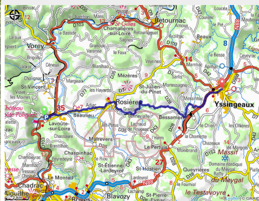
Sur le parcours de La Galoche à Rosières (Luc Olivier)