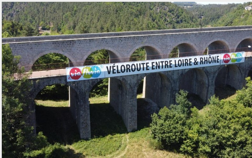
Via fluvia - Véloroute entre Loire & Rhône (Luc Olivier)