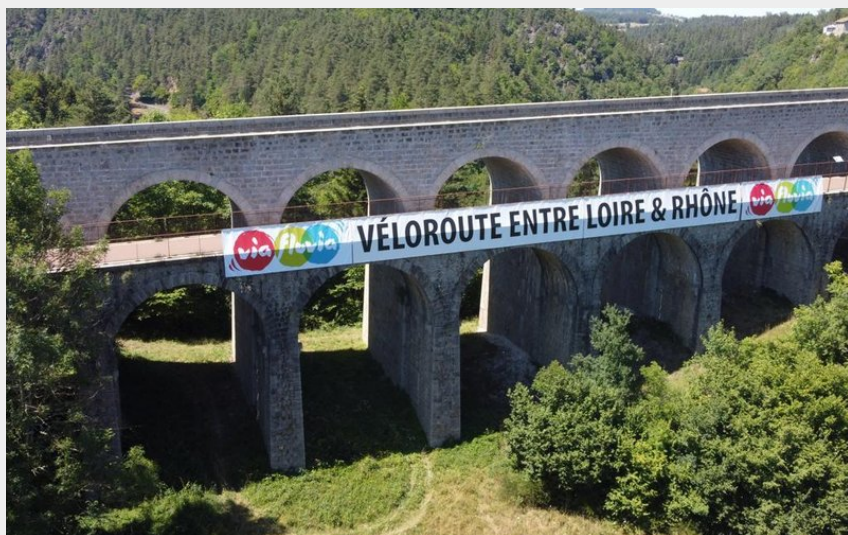
Via fluvia - Véloroute entre Loire & Rhône (Luc Olivier)