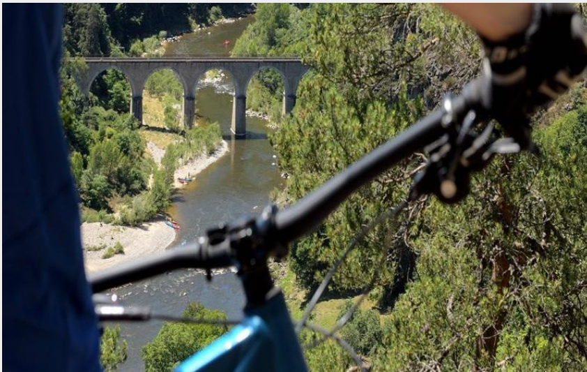
Vue sur le Lignon (Jean-Claude PARAYRE)